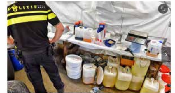
De 'teuken' van het methlab