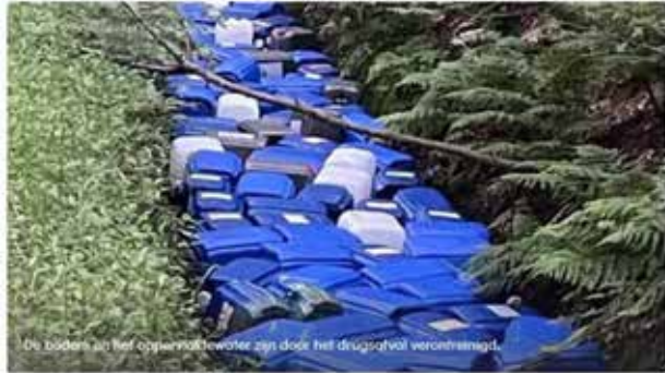
De bodem van het opgevoelde water zijn door het drugsafval verontreinigd.

22 mei 2023 09:31 - Aangepast 22 mei 2023 15:56