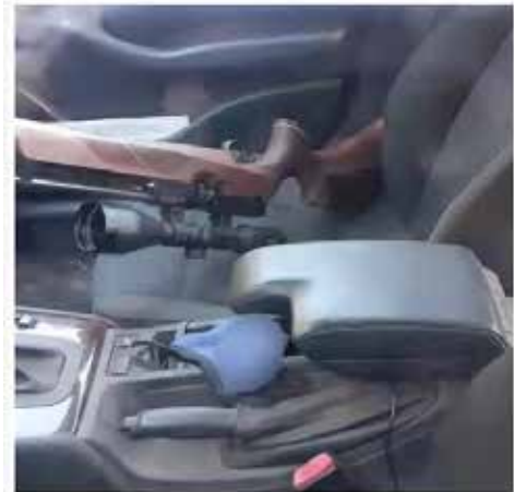
Het gewas van de veldstruik in Zundert.

In het Noord-Brabantse Achtmaal heeft de politie 381 jerrycans gevonden, met in verschillende jerrycans vermoedelijk drugsafval. Een groot deel van de jerrycans van 20 liter was leeg, of bevatte restanten van chemicaliën.